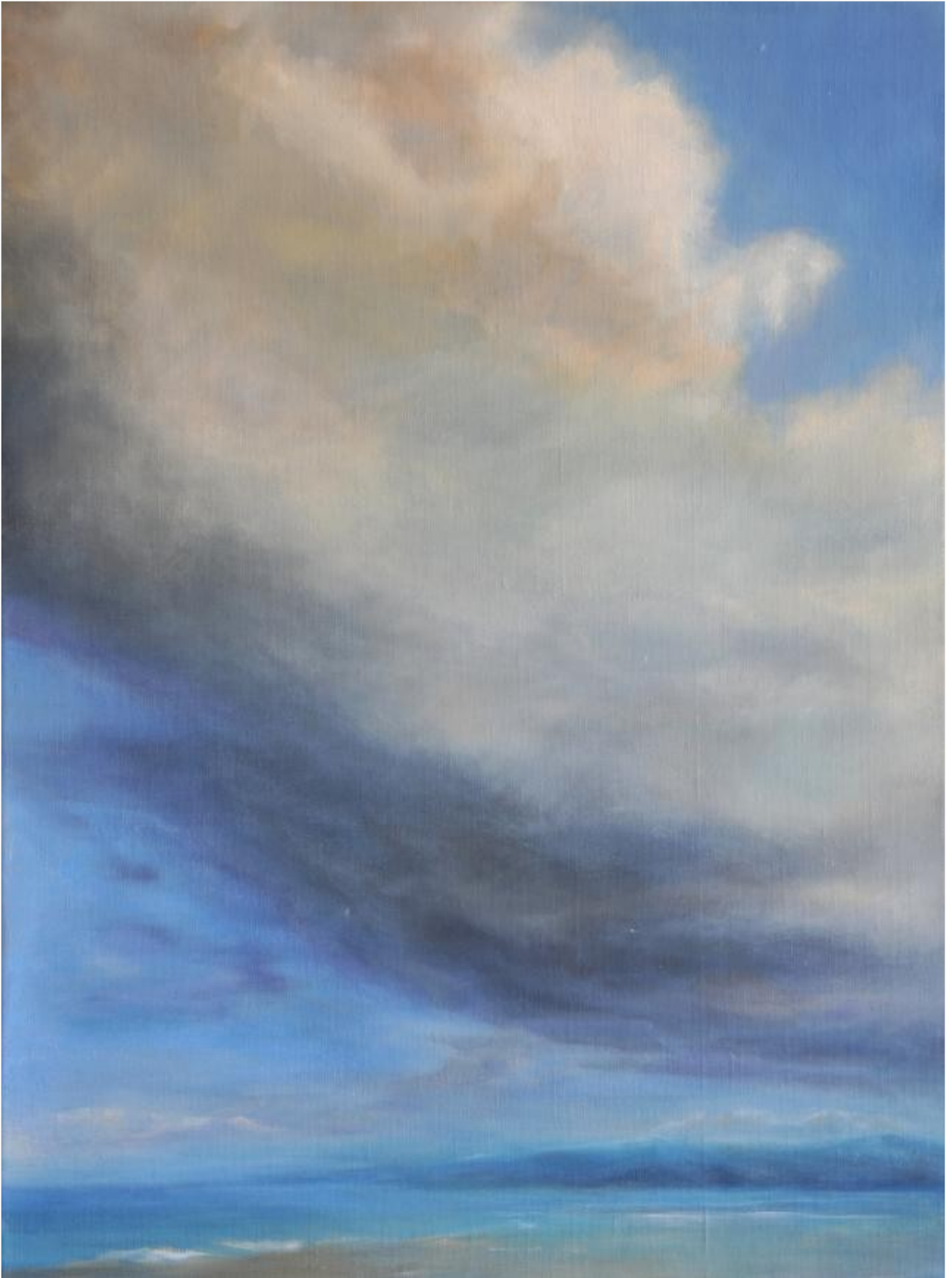
Le grain 73 x 54 cm