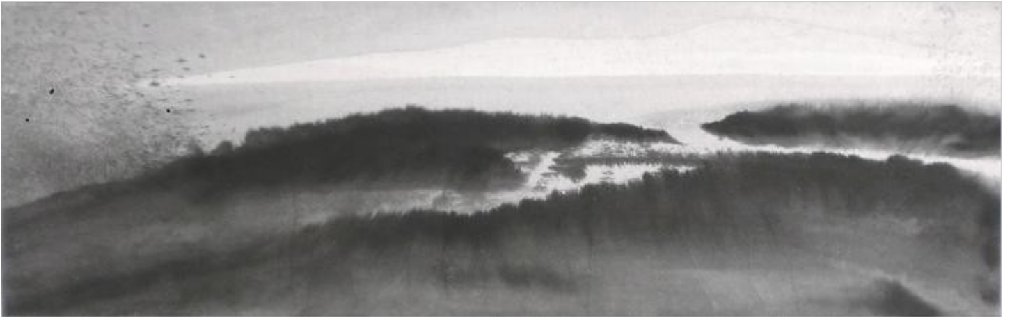
L'Aurore 20 x 60 cm Croisées 20 x 60 cm