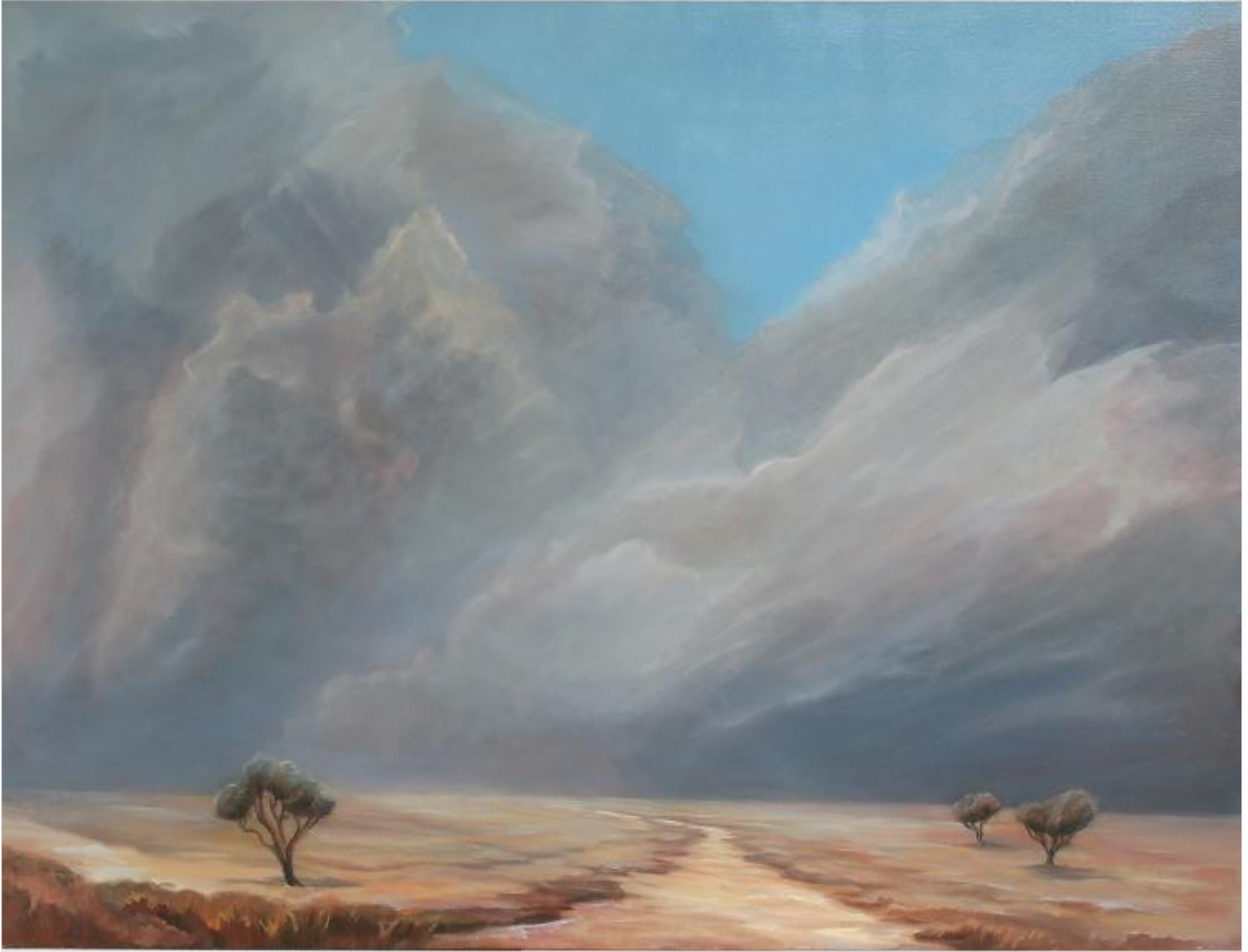
Le départ 89 x 130 cm