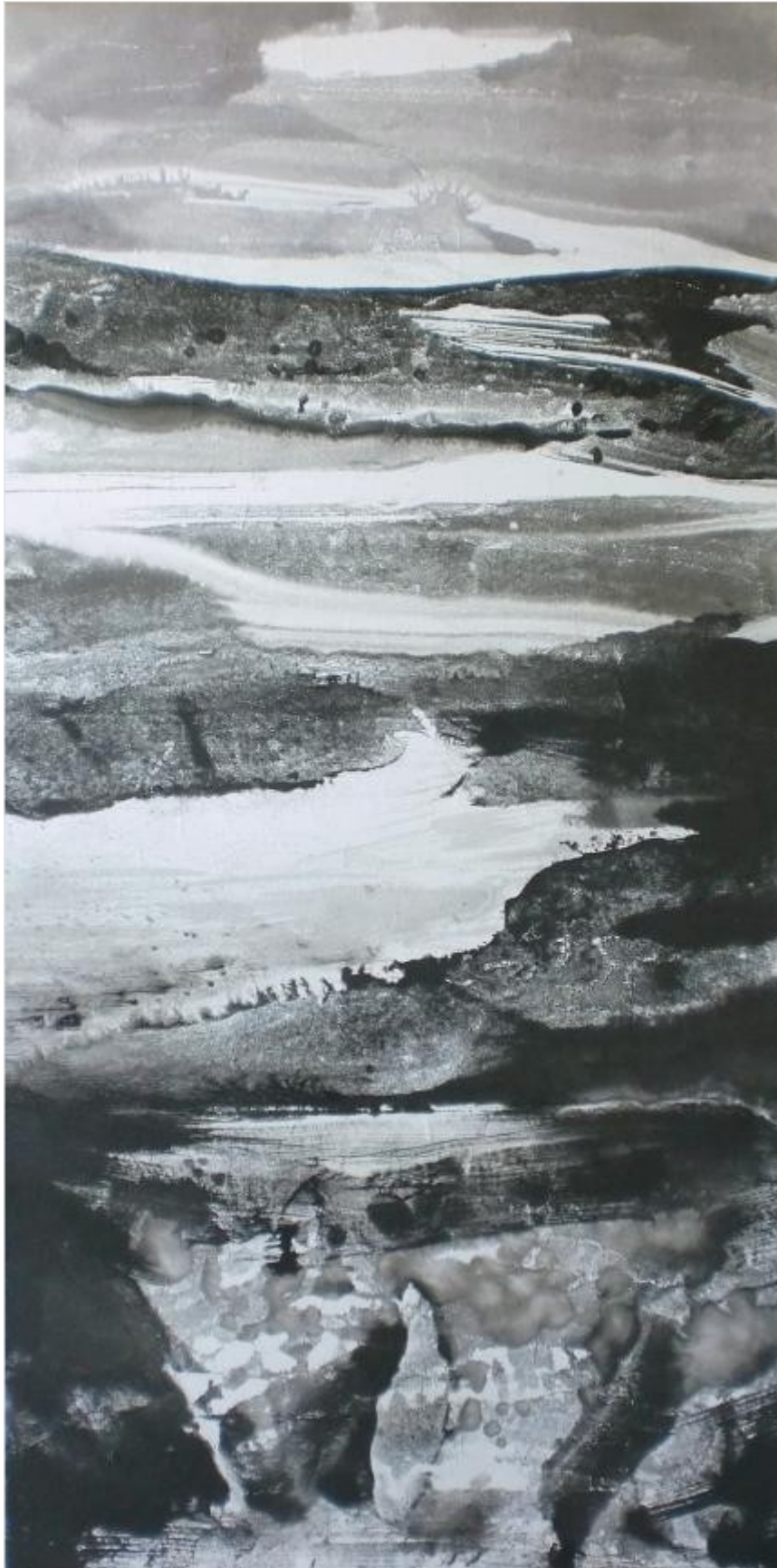
Termisvaara Hill 120 x 60 cm