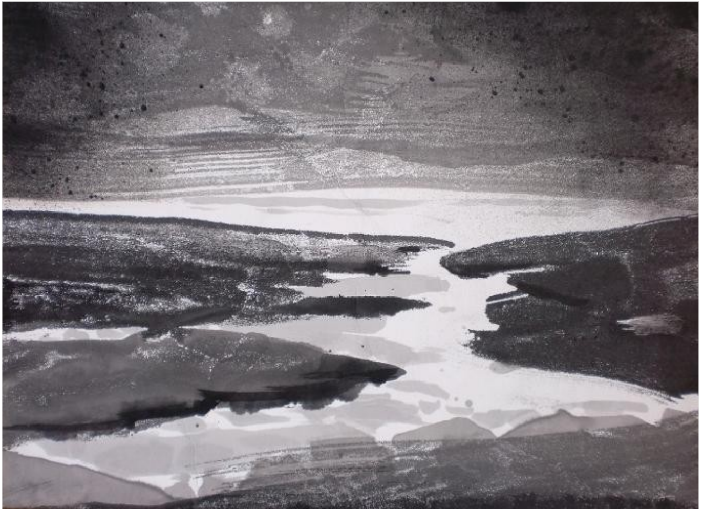
L'estuaire 38 x 55 cm