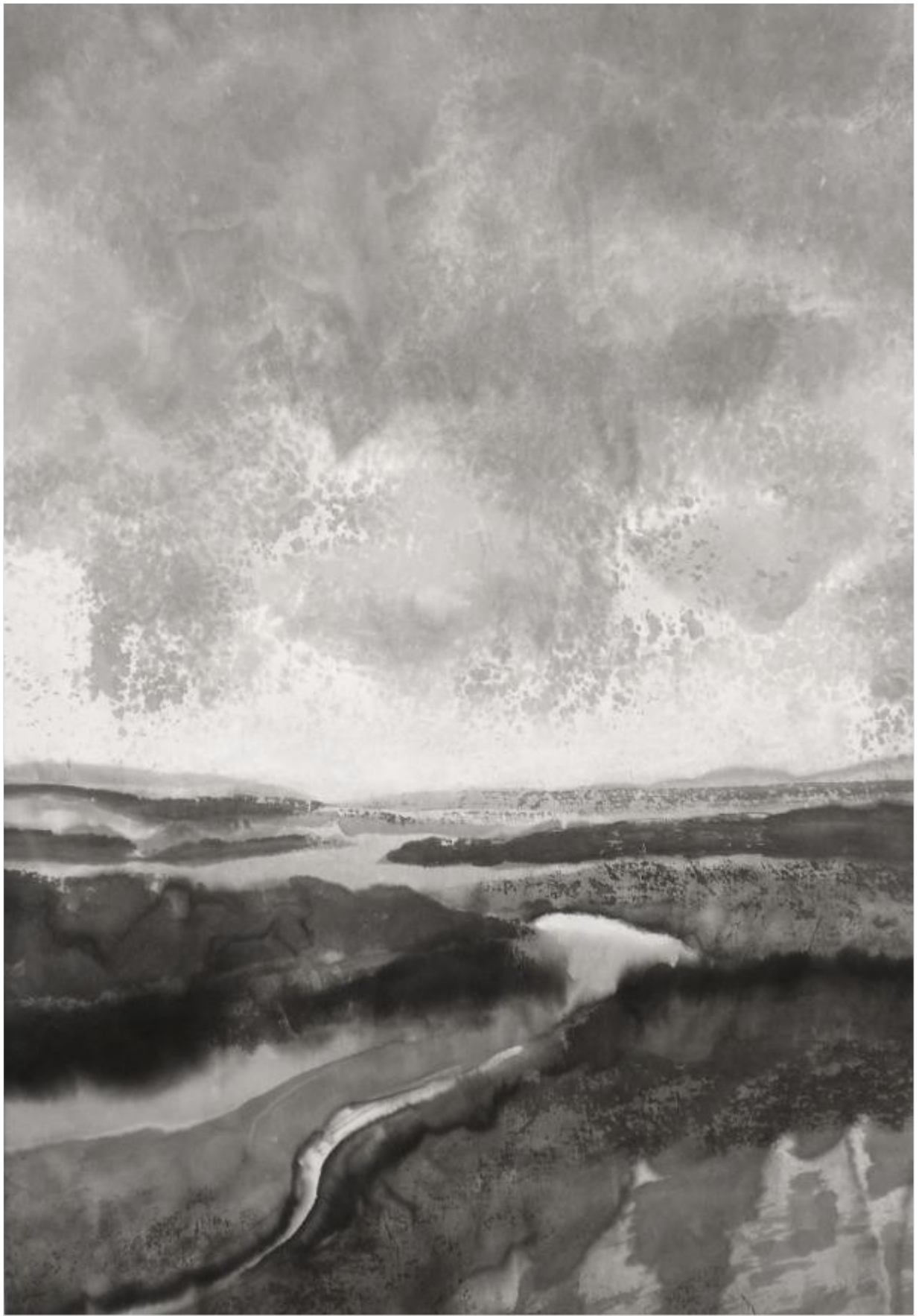
La Source 49 x 34 cm