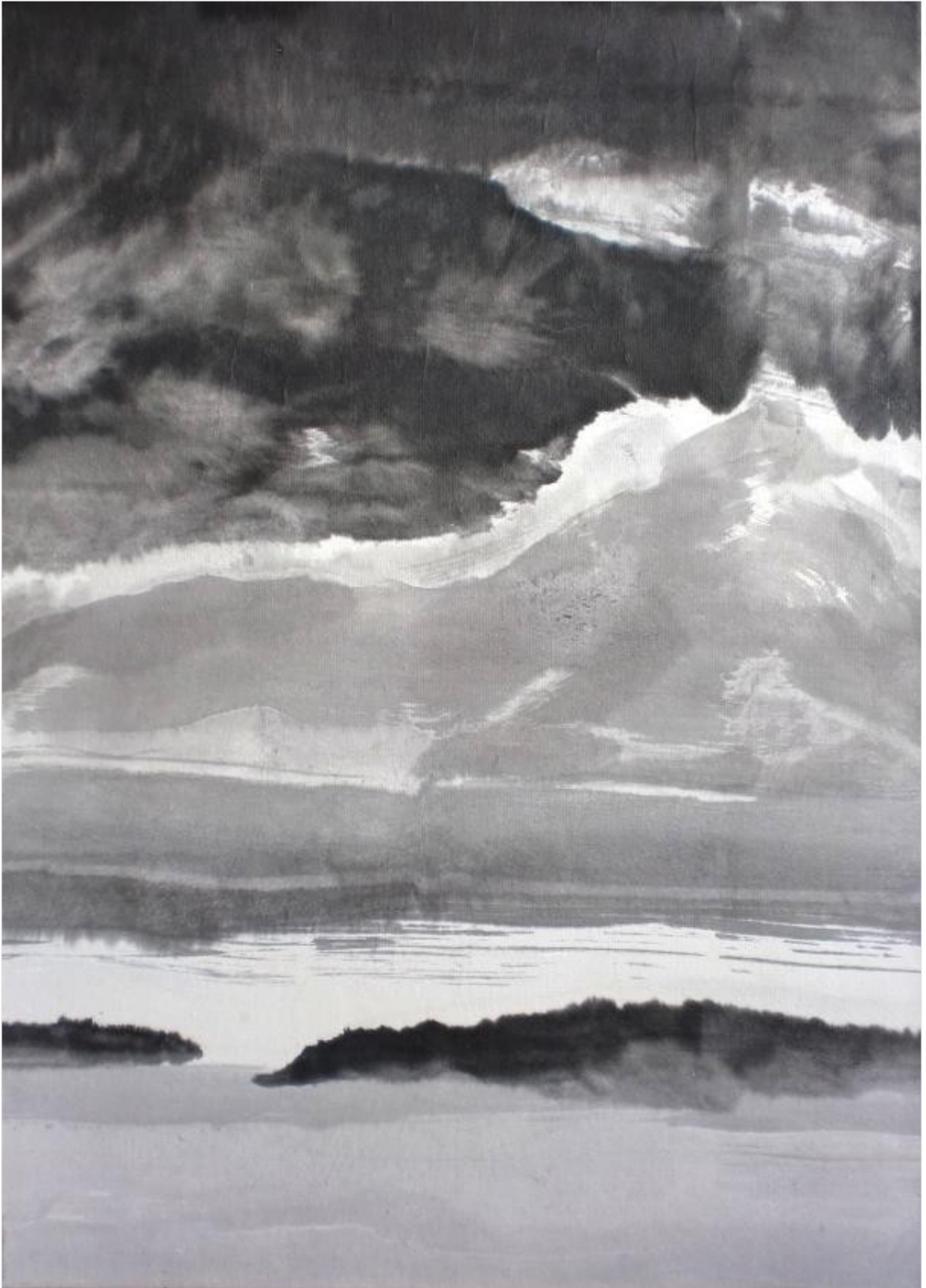
La cîme 65 x 46 cm