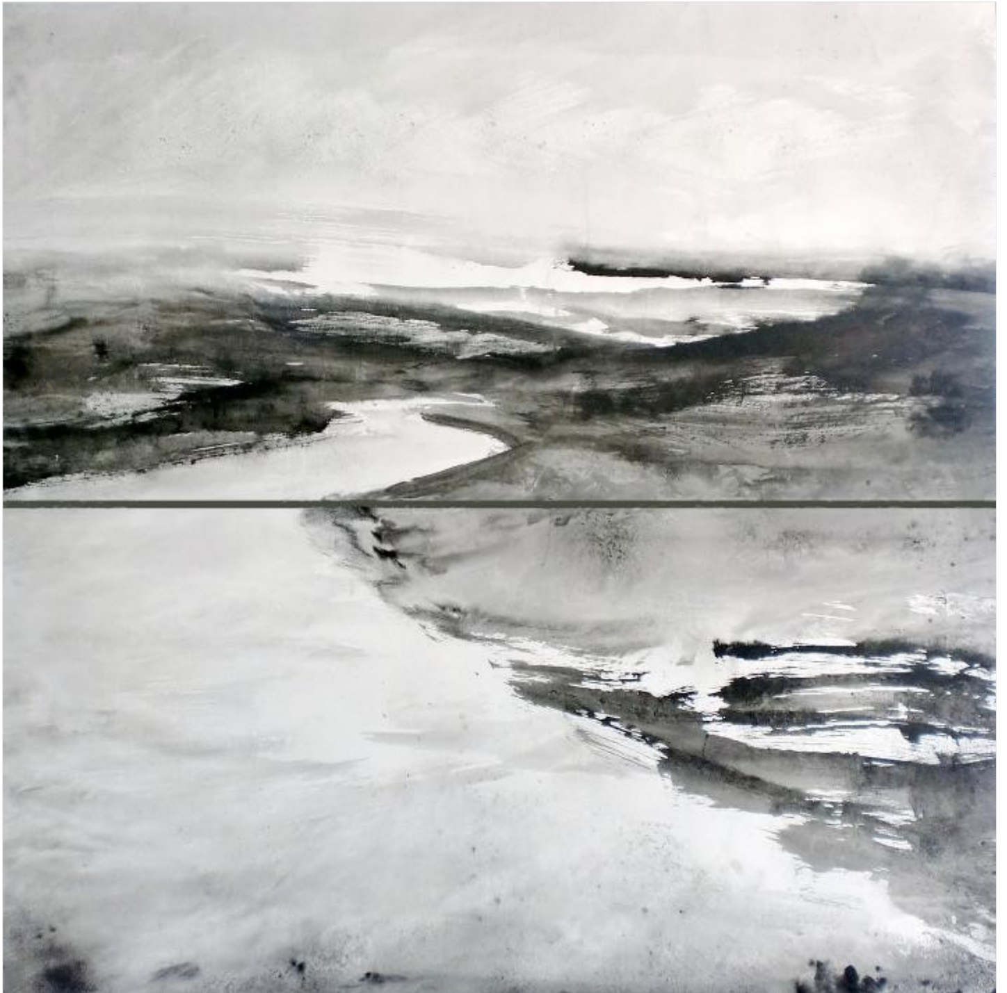
Le Fleuve N°2 - diptyque 120 x 120 cm