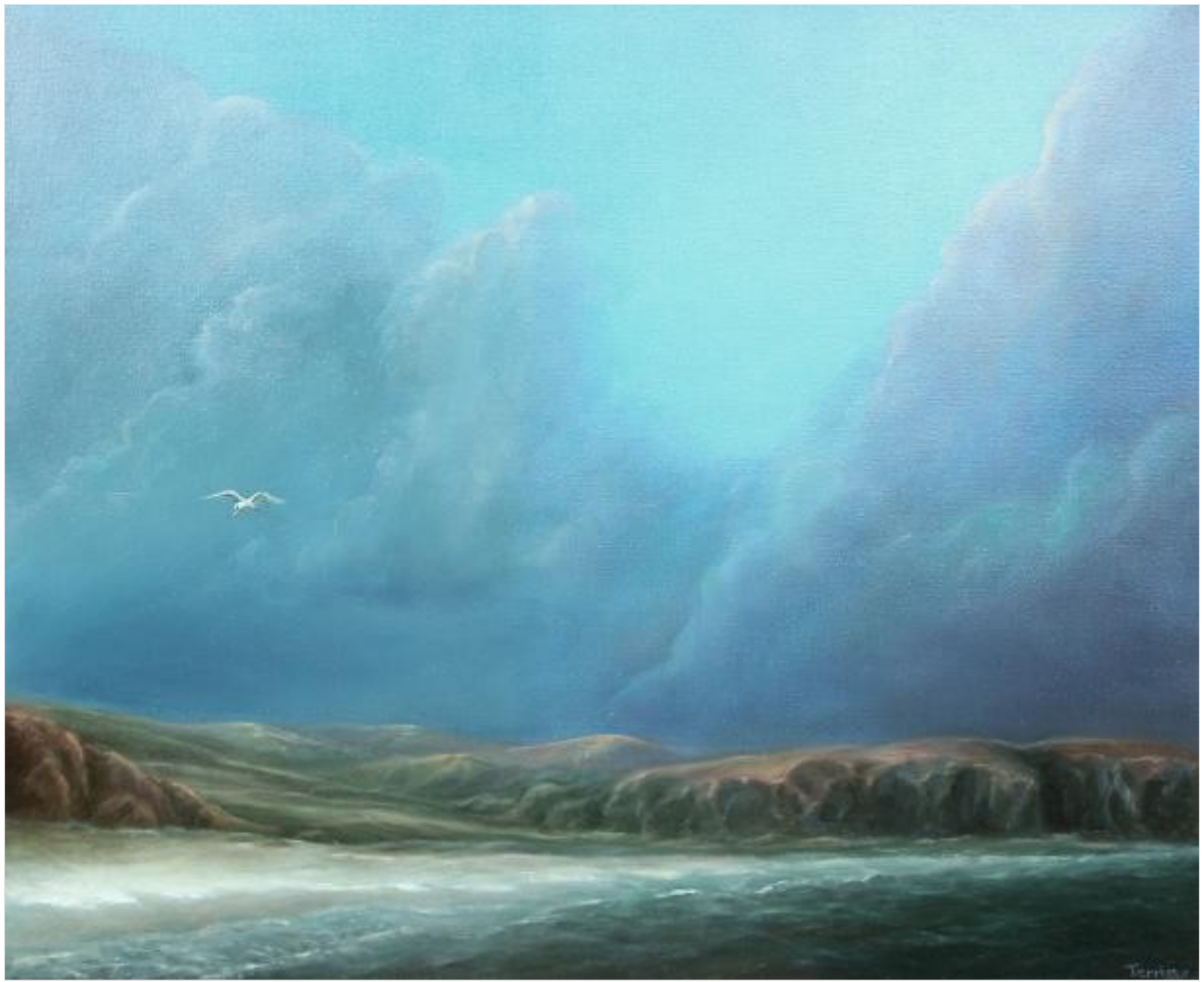
La Tempérance 54 x 75 cm