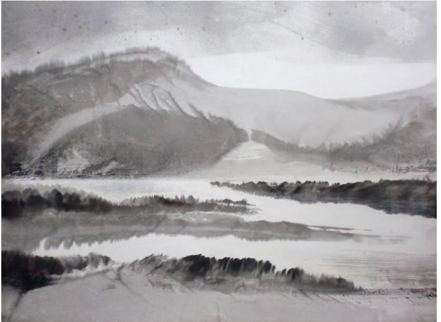
Rivages N°1 60 x 81 cm