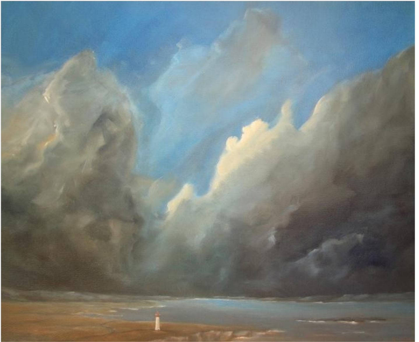
Le phare du Gréal 60 x 73 cm