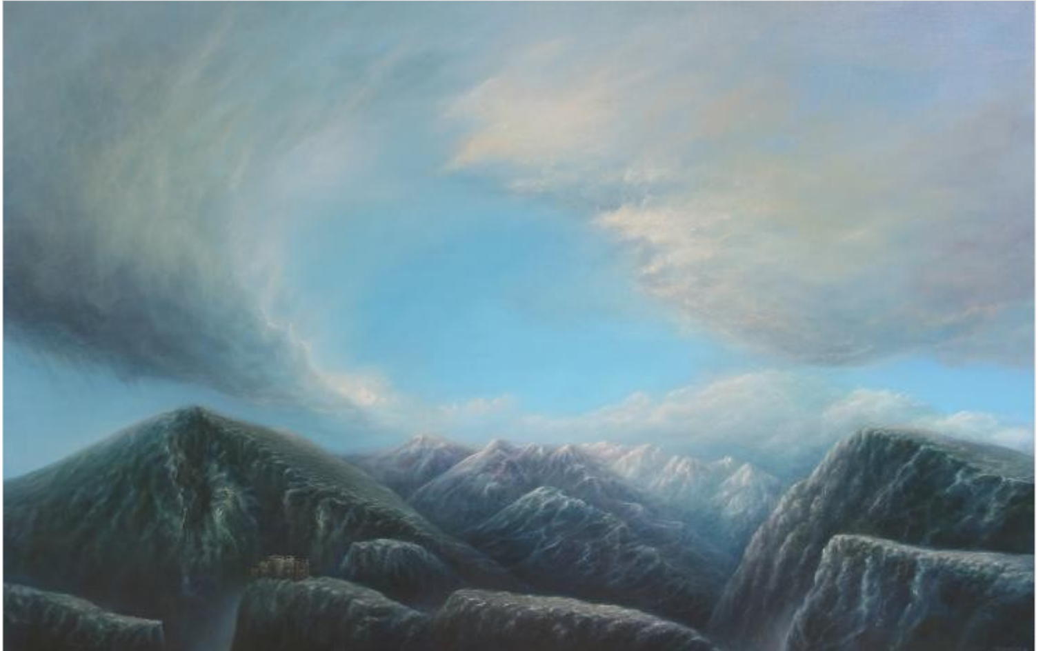
La Forteresse 89 x 130 cm