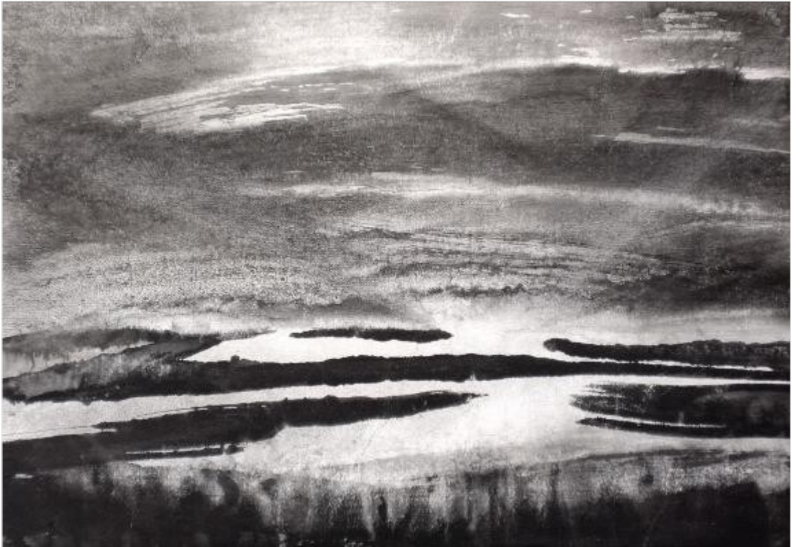
Le Fleuve N°1 38 x 55 cm Le Grand Nord 38 x 55 cm